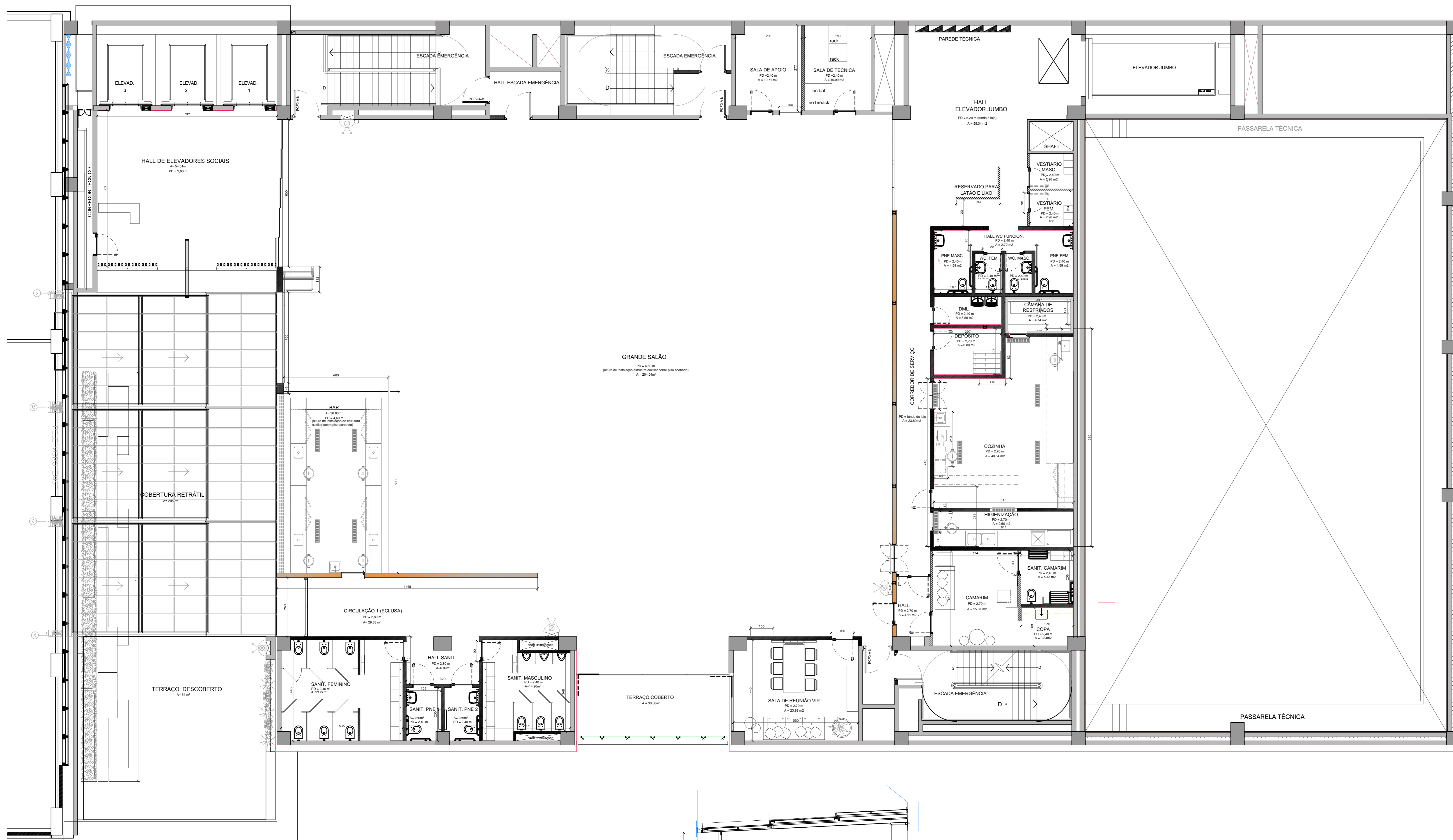
01 PLANTA DE ARQUITETURA ESCALA 1: 75